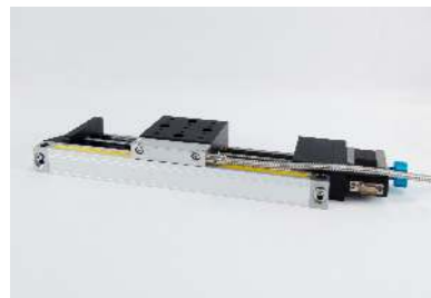
外接光栅尺平移台