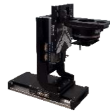
XZR三轴精密位移模组