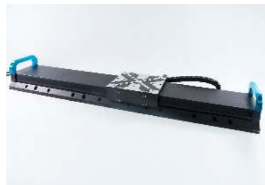
大行程高速平移台